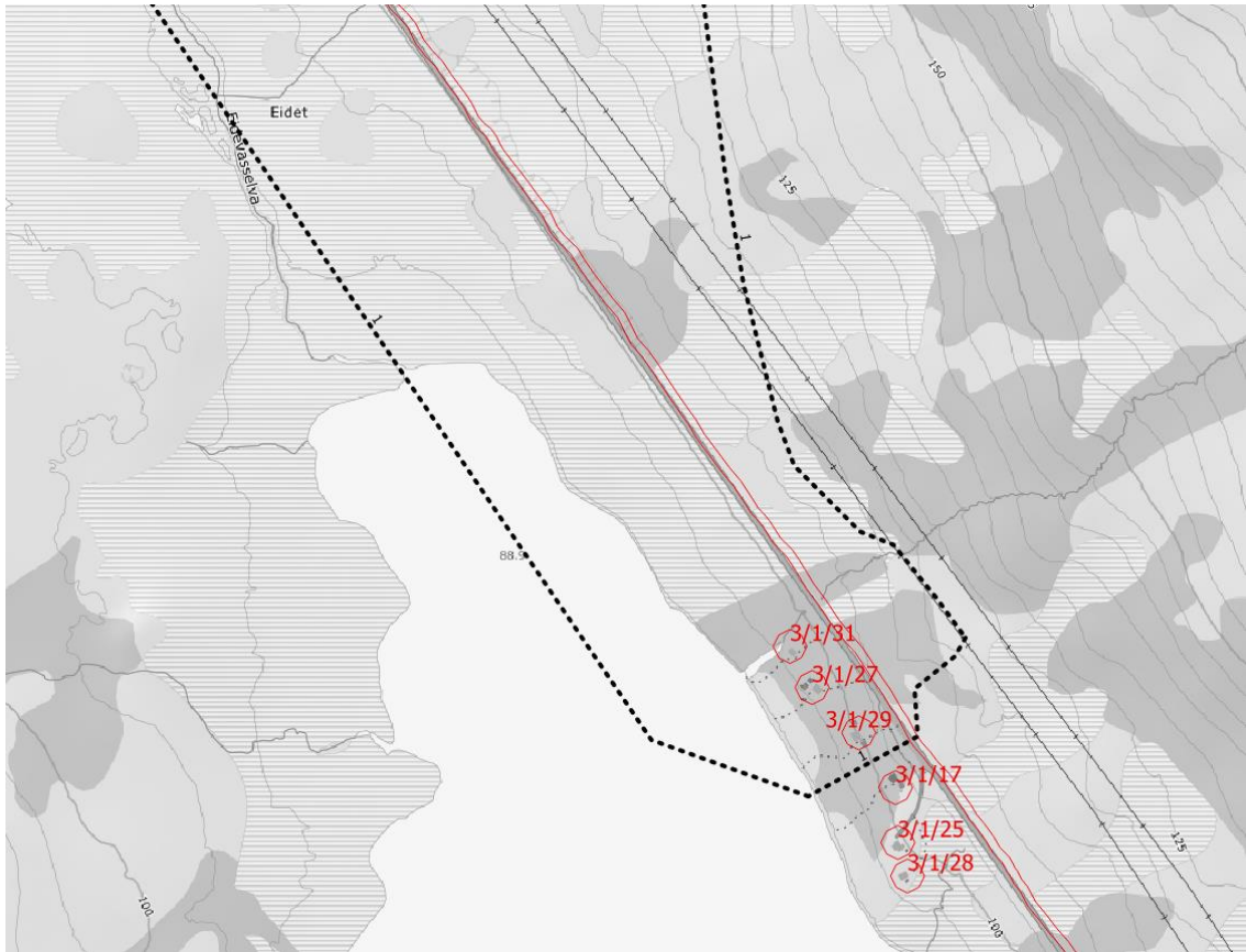
Figur 2: Sort stiplet linje viser vedtatt løypetrase