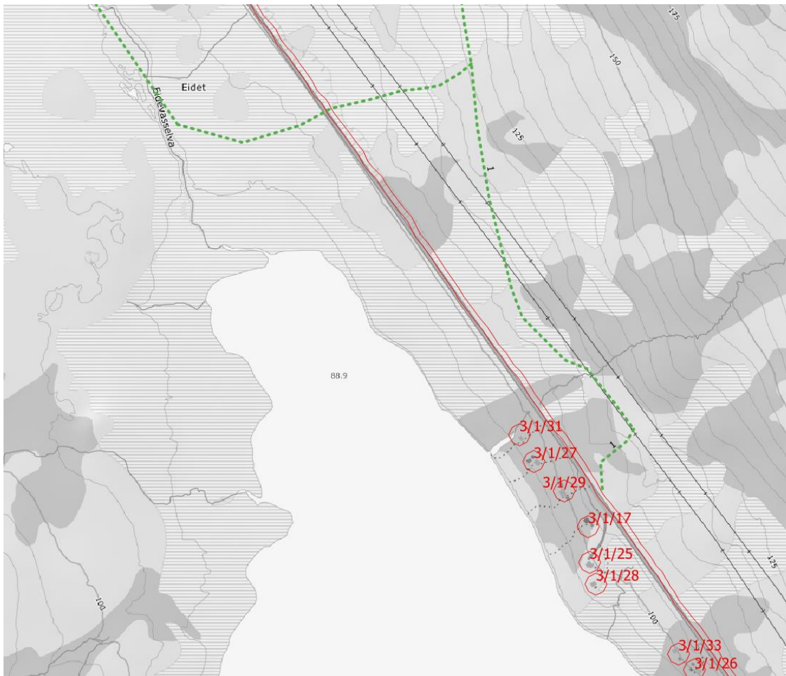
Figur 3: Grønn linje viser foreslått endring