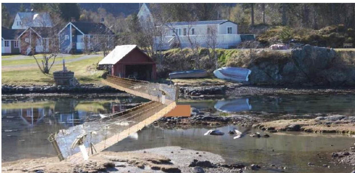
Figur 5: Fotomontasje av hengebro, illustrasjon fra planbeskrivelsen.

Det er regulert areal for å kunne bygge ei hengebro og turvegforbindelse mellom eksisterende campingplass og BC1 på Notaholmen.