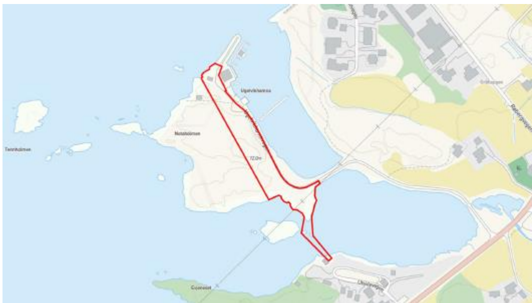
Figur 4: Planområdet - Revidert reguleringsplan 30.04.2021

I revidert reguleringsplan legges det opp til følgende tiltak i område for bebyggelse og anlegg.