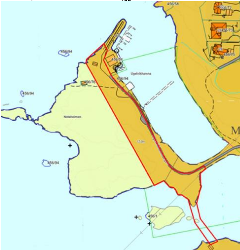
Figur 3: Utsnitt – kommuneplanens arealdel.

På bakgrunn av varslet innsigelse til planforslaget som ble lagt ut til offentlig ettersyn i desember 2020 har tiltakshaver nå revidert reguleringsplanen der bygging av utleiehytter er lagt i et område som i kommuneplanens arealdel er satt av til byggeformål.