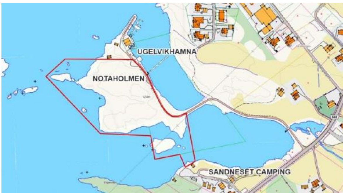
Figur 1: Planområdet – høringsforslag desember 2020.

Hensikten med reguleringsplanarbeidet er å omregulere deler av eiendommen GID 456/94 til turistformål. Det legges opp til bygging av utleiehytter og tilrettelegge et område for oppstillingsplass for campingvogn, bobil og telt med tilhørende fasiliteter som sanitærbygg og teknisk anlegg. Det planlegges bygging av gangadkomst/ gangbro over vika, mellom eksisterende campingplass og nytt campingområde.