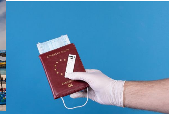
Jernej Furman (CC BY 2.0)