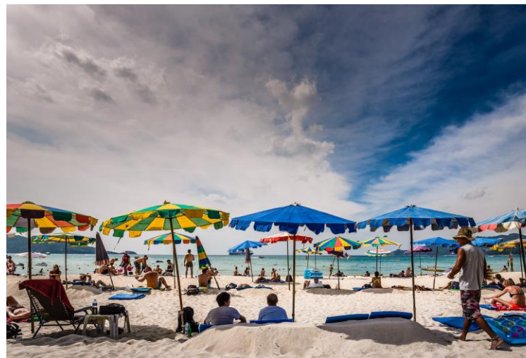
Tore Bustad (CC BY-NC-ND 2.0)