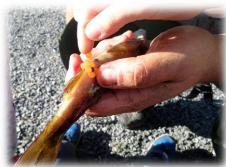
Hva skjuler seg inni fiskens mage tro? Fra fisketur på Skaret, september 2019.

Gevinsten ved å leke med barn er altså mange, og det skal være vårt fokus. Man blir bedre kjent med barnet og barnegruppen. Det hjelper også voksne til utvikling av det pedagogiske arbeidet og er en viktig inngangsport i observasjon og til selvutvikling i arbeid med barn.