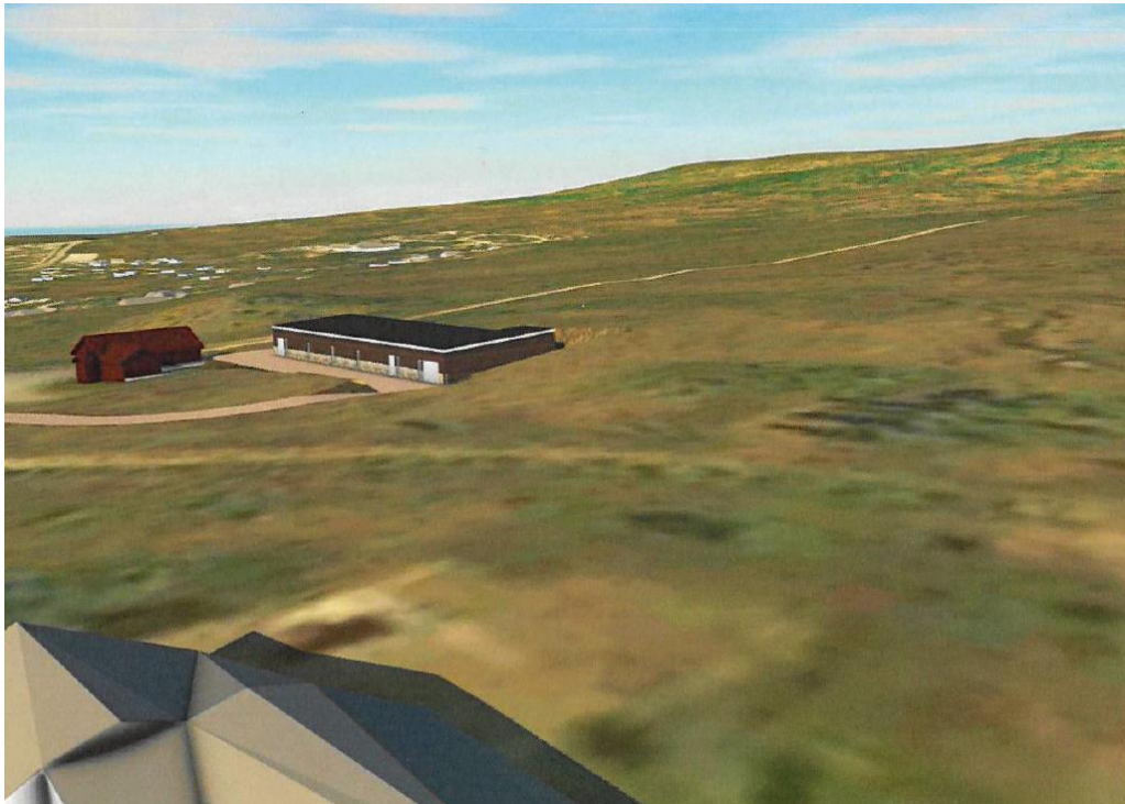
Over: Framtidig vassverk til høgre. Noverande til venstre.