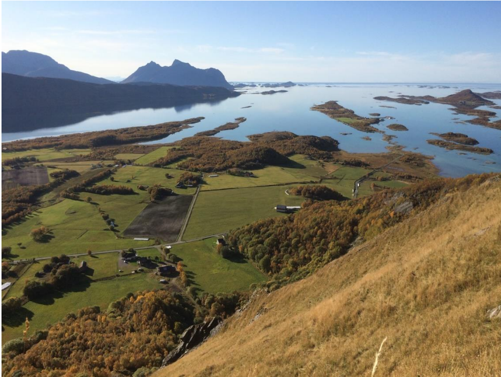
Beiteli-Våg -Engeløya. Steigen

Generell søknadsfrist er satt til 1.04 Søknadene skal behandles innen 15.05