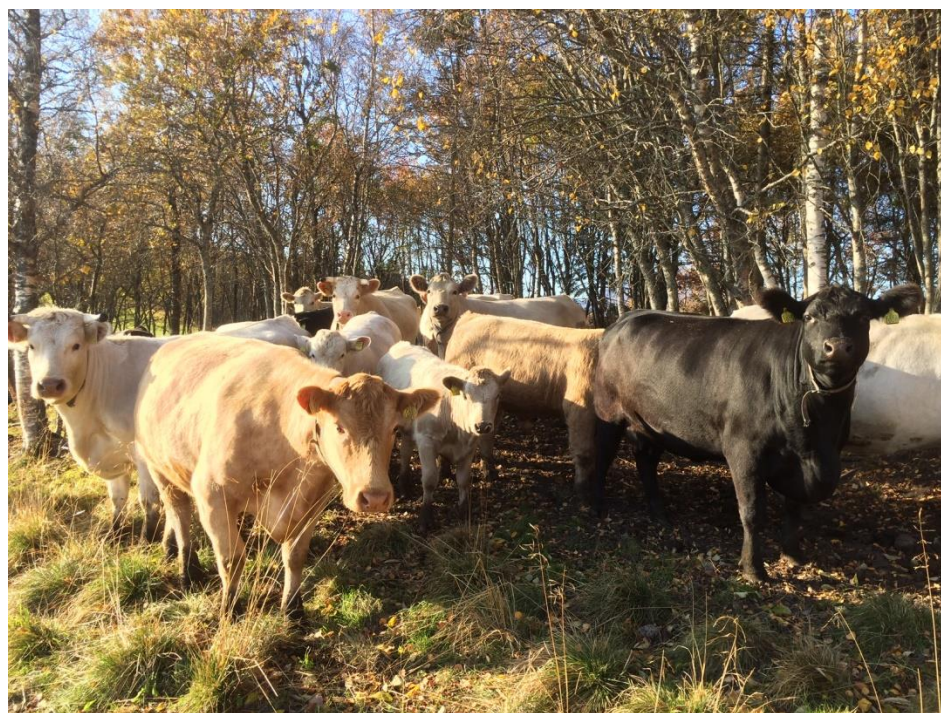
Kyr på beite-Uteid. Hamarøy