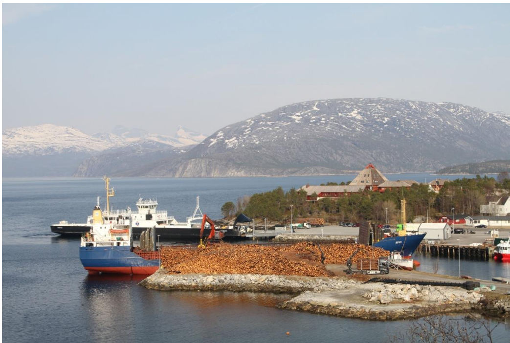
Utskiping av tømmer-Drag. Hamarøy