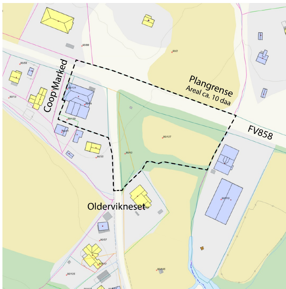
Figur 1: Plangrenser for detaljregulering 1933-273 Coop Nord SA, Meistervik. Gbnr. 90/ 34, 41, 43, 127, 130 og 131. I tillegg del av FV858 med Gbnr. 90/126 og KV Oldervikneset Gbnr. 90/132.

I medhold av PBL §12-8 kunngjøres herved oppstart av detaljregulering Reguleringsplan for Coop Nord SA, Meistervik – Plan nr. 1933-273.