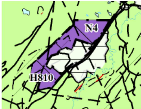
Utsnitt fra KPA

Iht. bestemmelsene i kommuneplanens arealdel skal det foreligge detaljreguleringsplan for N4 før gjennomføring av søknadspliktige tiltak kan gjennomføres. Utover dette er det ingen bestemmelser for næringsformål.