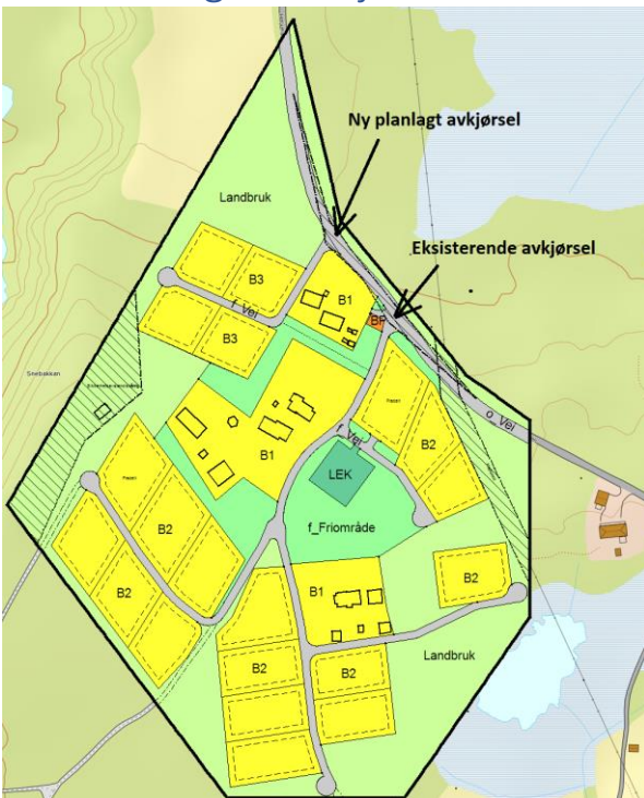
Figur 2: Avkjørsler og veisystem i planområdet

Reguleringsplanen Snebakkan legger til rette for 24 boligtomter innenfor planområdet, hvor 17 ikke er fradelt i dag. Kjøremonstret internt i feltet er planlagt med vendehammere.