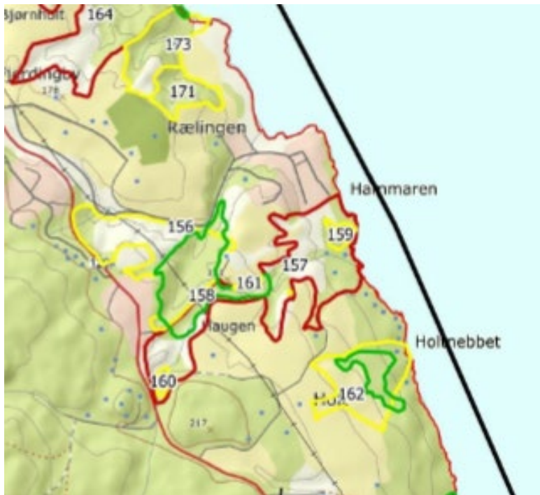
Figur 2: Ravinelandskapet nær planområdet. Fra BioFokus-rapport 2017-18. 156 Hammarsvegen, C-lokalitet (gul), 157 Sørlibekken, A-lokalitet (rød), 158 Hammaren, B-lokalitet (grønn) og 161 Haugen, C-lokalitet (gul) er innenfor, eller grenser til planområdet.