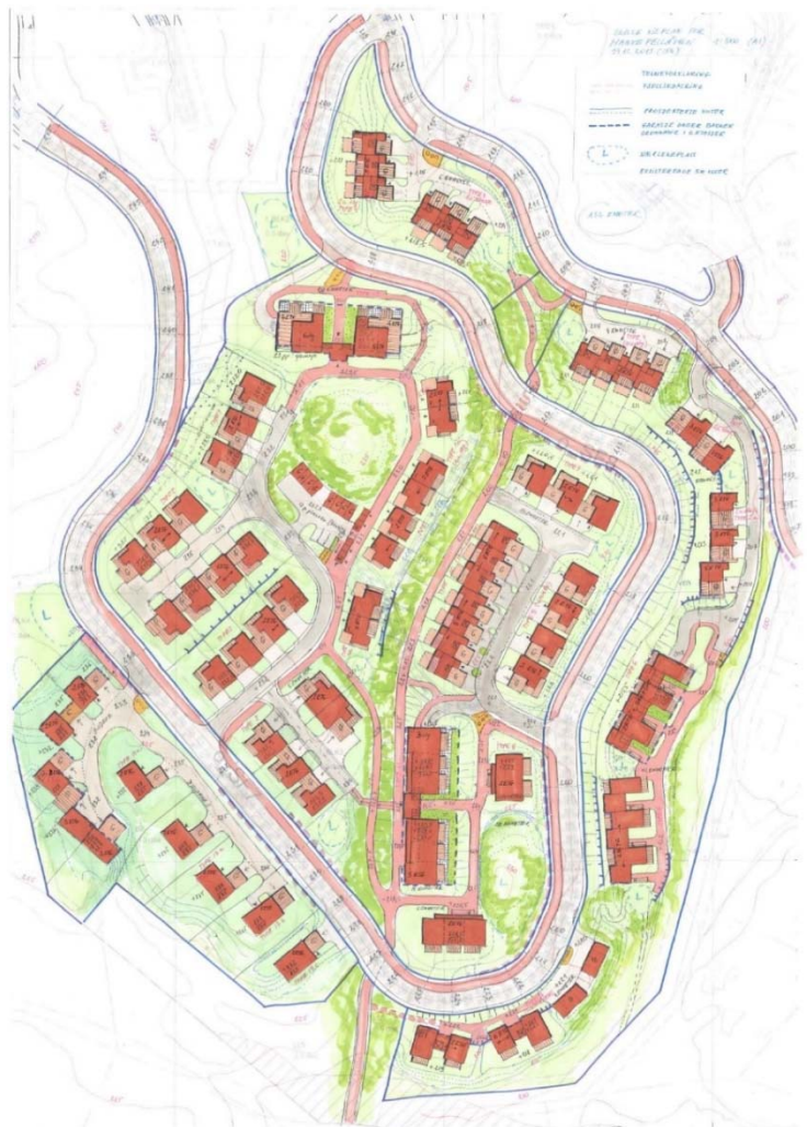
Foreløpig skisse for mulig utvikling Hansefell sør

Oppstart av detaljregulering for felt B1-3 i nordlig del av områdeplan for Hansefellåsen ble varslet 23.01.18. Rælingen kommune vurderte etter gjennomført varsling at det bl.a. av hensyn til trafikkbelastning på Kirkebyvegen er mer hensiktsmessig med byggestart i sørlig del. Følgelig er planarbeidet i nord lagt i bero inntil detaljregulering og utbygging i sør er gjennomført.