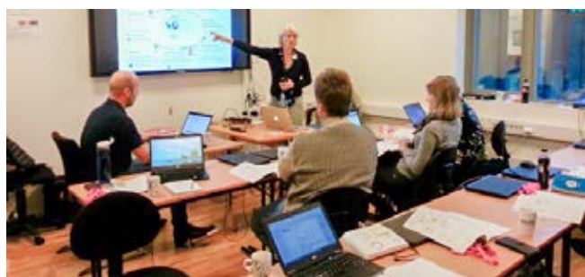
Opplæring av superbrukarar i Lindås ved Vakt og Alarm og Imatis: