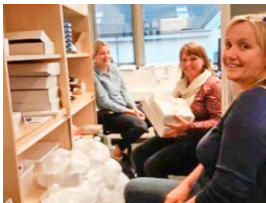
Klargjering av utstyr i Lindås