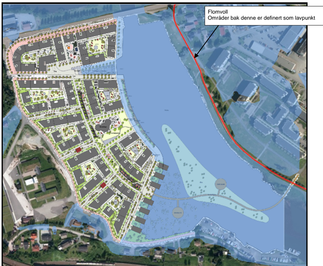
Flomutbredelse for en 200-års flomhendelse ved alternativ 1 og utfylling opp til kote 106.5.