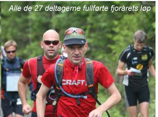
Alle de 27 deltagerne fullførte fjorårets løp