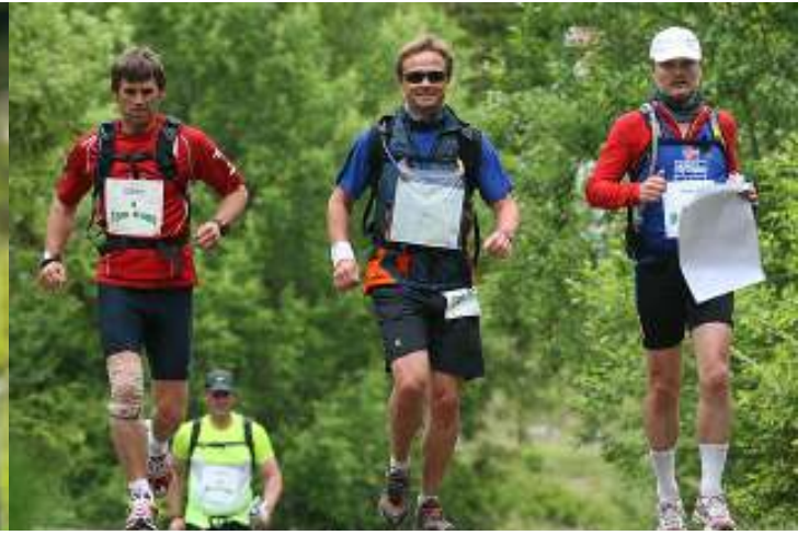
Fire av de 27 deltagerne i fjorårets løp