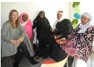
Ressursgruppe som har bistått med veiledning og undervisning om kvinnehelse

Kurs som tar for seg tema som kulturforskjeller/-forståelse, migrasjonsfaser, stressmestring, psykisk og fysisk helse, søvn og kosthold. Kurset avholdes tidlig i introduksjonsfasen.