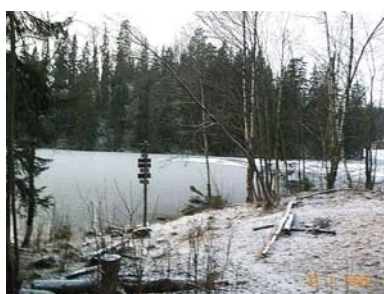
"Lombardiet" (ved Halssjøen)

4 timer og ennå "langt igjen"... 4 timer og ett minutt. Kloppa i nordenden av Halssjøen var dagens 4.siste post – turen var allerede lenger enn lang – og vi kom inn i et stiparti som nok Stein gjerne ville byttet ut med asfalt.