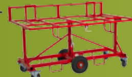
JONEX PLATEBORDVOGN Platevogn for gips, sponplater, glass mm. (side 186)