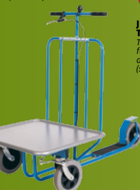
MONARK SKARKESYKKEL Sparkesykkel for bruk i de fleste inndørsmiljøer. (side 189)