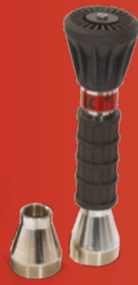
MULTIFIRE STRÅLERØR Et solid og brukervennlig strålerør med lang levetid (side 254)