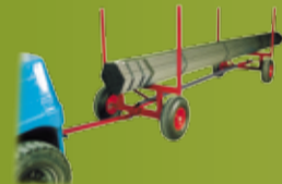
JONEX MATERIALVOGN Robuste materialvogner for transport av langgods. (side 169)