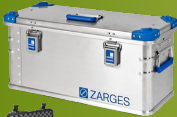
ZARGES EUROBOX Nye størrelser: 60x30x30 og 120x80x70 (side 99)