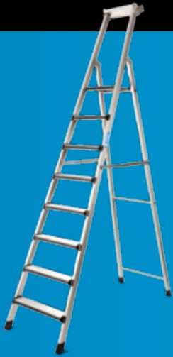
ZARGES PROFFTRAPP G 421 Med avstiverstag! (side 15)