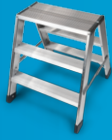
ZARGES PROFFBUKK OKOPROFF XL Større topplate (30x60 cm) (side 22)