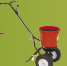
JONEX SALT- OG SANDSPREDER Gjør fortøyene trygge i vinter med Jonex salt- og sandspreder. (side 188)