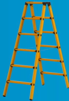
AVANTI GLASSFIBERSTIGER Godkjent til 90.000 volt (side 49)