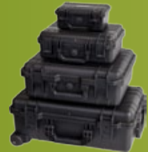
OPTI CASE Utstyrskofferer i ABS-plast (side 121)