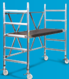
ZARGES Z 600 PROFF KLAPPSTILLAS Lavere pris (side 77)