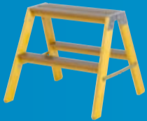
TREBUKK Bukk, med ERGO trinn på begge sider (side 45)