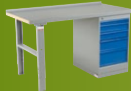
MAX ARBEIDSBORD Ekstra kraftige arbeidsbord med justerbare bein og stålplate (side 132)