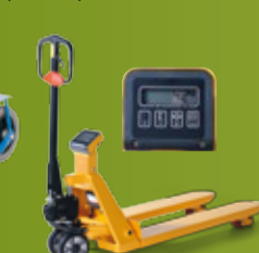
JONEX JEKKESTRALLE MED VEKT Veier godset man har på pallen med en innebygget vekt (side 194)