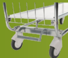
HYLLEVOGNER MED SENTRALLÅSESYSTEM Fleksible vogner med 2, 3 og 4 hyller i 2 forskjellige lengder. (side 173)