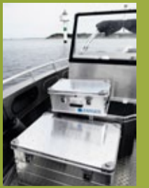
ZARGES K 470 IP 65 Lavere pris (side 101)