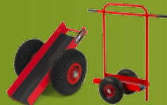
JONEX TRANSPORTHJELPER Transporthjelper godt egnet for transport av vinduer, dører og plater etc. (side 184)