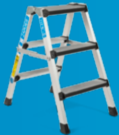
ZARGES PROFFBUKK G 411 Med avstiverstag! (side 20)