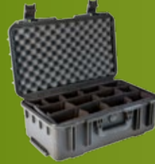
SKB INSTRUMENTKOFFERTER Nye størrelser (side 118-119)