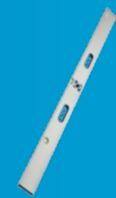
MAX RETTHOLT Stabile rettholt med to libeller og to håndtak. (side 70)