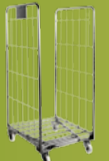
JONEX RULLECONTAINER - STABELBAR Robuste rullecontainere som tar liten plass når de er uten last (side 178)