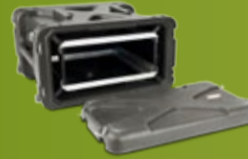
SKB 19" SHOCKRACK KABINETT Solide, bærbare kabinetter for 19" elektronikk (side 120)