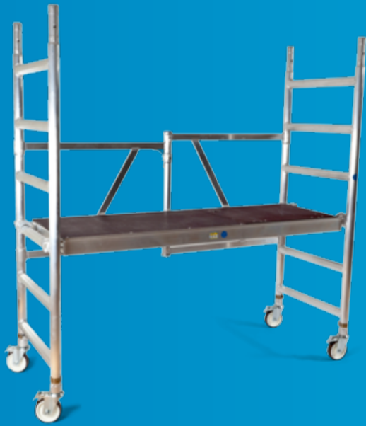
ZARGES Z 400 PROFF KLAPPSTILLAS Et robust og lett klappstillas i aluminium godkjent for proffbruk (side 77)