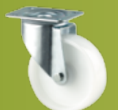
TENTE TRANSPORTHJUL m/ gaffel i elforsinket stål 200-350kg (side 218)