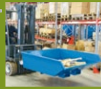
LAVTBYGGENDE CONTAINER Utrustet med trykkplate for automatisk tomning med lav høyde 520 mm (side 143)