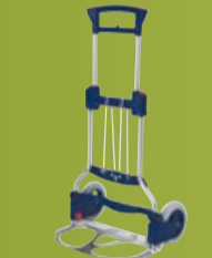
RUXAC SAMMENLEGGBARE TRALLER Lavere pris (side 164)