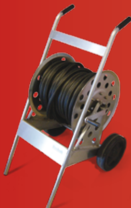
SVEBAB SLANGETROMMEL Rustfri slangetrommel! (side 234)