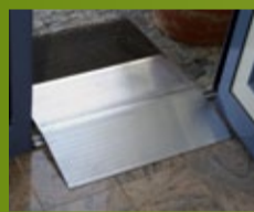
JONEX TERSKELBRO Stabil og kraftig terskelbro i aluminium. (side 168)