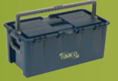
RAACO VERKTØYKASSER Nye varenr. og rabatter. (fra side 126)