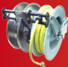
EBINGER SLANGETROMLER Lavere pris (side 232)