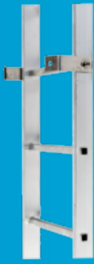
EUROSTAR KUMSTIGER Robuste stiger i aluminium, med stigesko i begge ender. (side 39)