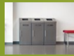
KILDESORTERING - AVFALLSHÅNDTERING Løsninger for effektiv avfallshåndtering og kildesortering (side 146)