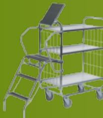
JONEX PLUKKVOGN Fleksibel plukkivogn i tre ulike høyder og trinnløst juster- bare hyller. (side 172)