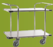
JONEX RUSTFRIE HYLLEVOGNER Rustfrie hyllevogner med to og tre hylleplan og polstrede hjørner. (side 175)