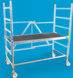
ZARGES Z 200 LETTSTILLAS Lavere pris (side 84)