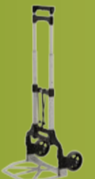
SAMMENLEGGBAR ALU TRALLE 60 KG Lett og kompakt sammen- leggbar aluminiumstralle for allsidig bruk. (side 170)