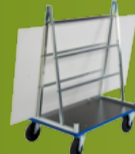
JONEX PANELVOGN Vogn godt egnet for transport av plater, dører og vinduer. (side 168)