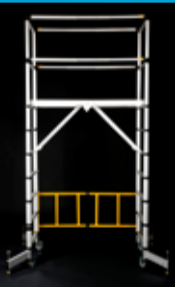
TELETOWER Teleskopisk stillas med fem justerbare høyder fra 1-2 m med arbeidshøyde 3-4 m (side 90)