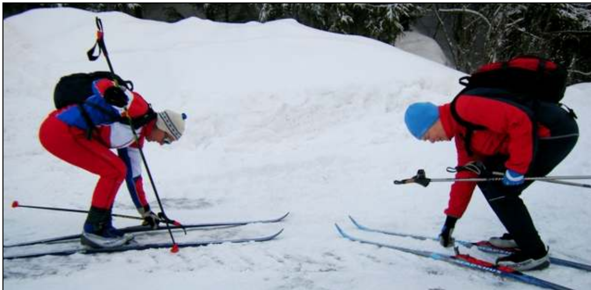
På med skia, klokka er 07:30... det er lyst i 10 timer til.

Men... søndag 13.februar var vinterens kaldeste med -26C på morgenen, helt uaktuelt. Turen ble utsatt til søndag 20.februar. Søndag 20.februar var vinterens nest kaldeste dag... vi drøyde i det lengste, men det var -22C i Losby så sent som kl 10:00. Dermed endte det likevel med søndag 27.februar og vi fikk nesten idéelle forhold med temperatur fra -6C til -3C, soldis og nesten vindstille. Mindre heldig var vi med 95% upreppa løyper etter snøfall de to dagene før.