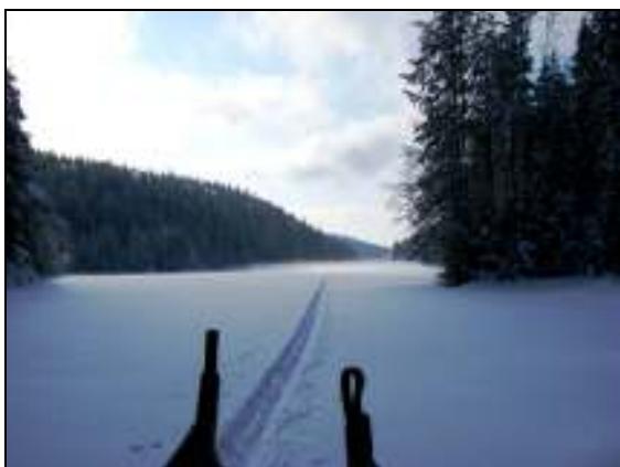
Vi måtte trække i løssnø med skarelag inn til postene...

Opp fra Røyrvannet var det kort til posten (11) ved Lamannspalten. Også denne posten lå litt vekk fra skiløypa, og mens vi sto der og tok en slurk av termosene kom en skiløper vi nettopp hadde passert etter oss inn til posten. De andre i familien ventet i "løypekrysset" mens han sjekket opp løypa vi valgte – som altså ikke var der han skulle gått, så han slukøret måtte ta løypa tilbake til de andre.