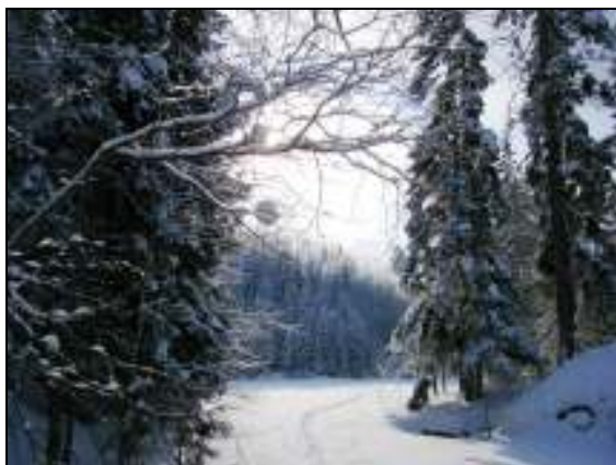
Bilde fra turens østligste punkt ved Nordbysjøen

Nok en gang kom jeg greit ned en bakke, riktignok med elendig stil, og nok en gang havnet jeg bakpå nede på vannet. Her var snøen så dyp at jeg måtte ta av meg skia for å komme i vater igjen.