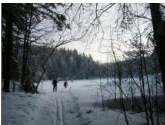
Dette bildet er tatt i det vi kommer ned til Østbyputten etter en tøff åpning opp Veslevannsdalen. På dette tidspunktet hadde jeg allerede tryna én gang.

Sammen med to spisepauser og litt annet småstopp blir det da ca 9 timer netto skigåing til årets Skijegerposter av en total tid på 9.45.