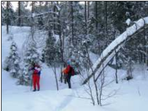
Fra post 5 sørøst i Åmotdammen