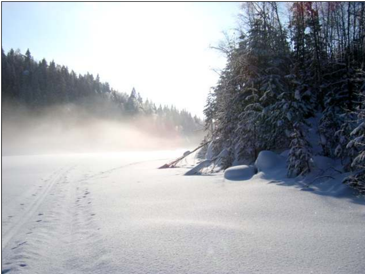
Fin stemning ved Søndre Krokvann.