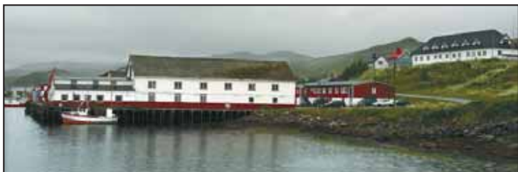
LANDAREAL: Her er det meningen at Båtsfjordbruket skal få nytt landareal.

Skoleungdommen har en begynnerlønn på 120 kroner timen. For de med erfaring er timebetalingen 140 kroner. I tillegg har de anledning til å jobbe overtid, og tjener deretter. I fjor var snittinntekten for ungdom som valgte å jobbe ved Båtsfjordbruket i sommerferien mellom 25.000 og 30.000 kroner. Noen av ungdommene tjente i fjor sommer opp mot 70.000 kroner.