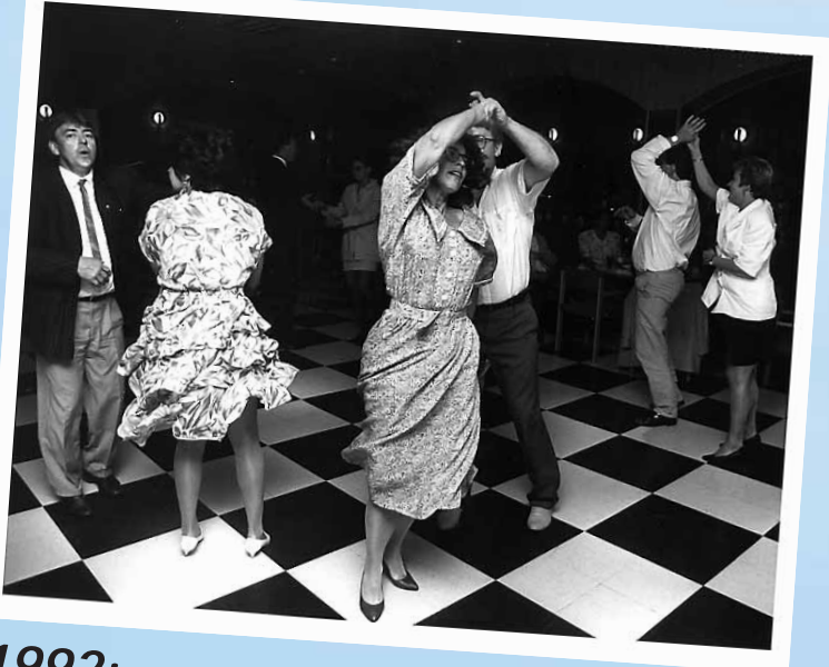
1992: Svingkurs på Skansen.