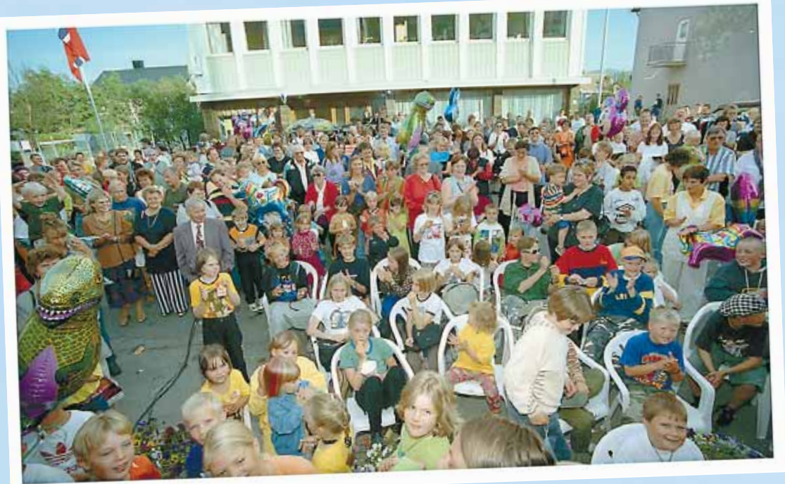
1997: «Båtsfjord i fest» er folkefest.

Båtsfjord Turistsenter AS vil prøve å få til forskjellige utflukter. Nærmere informasjon fåes på tlf. 83 430.