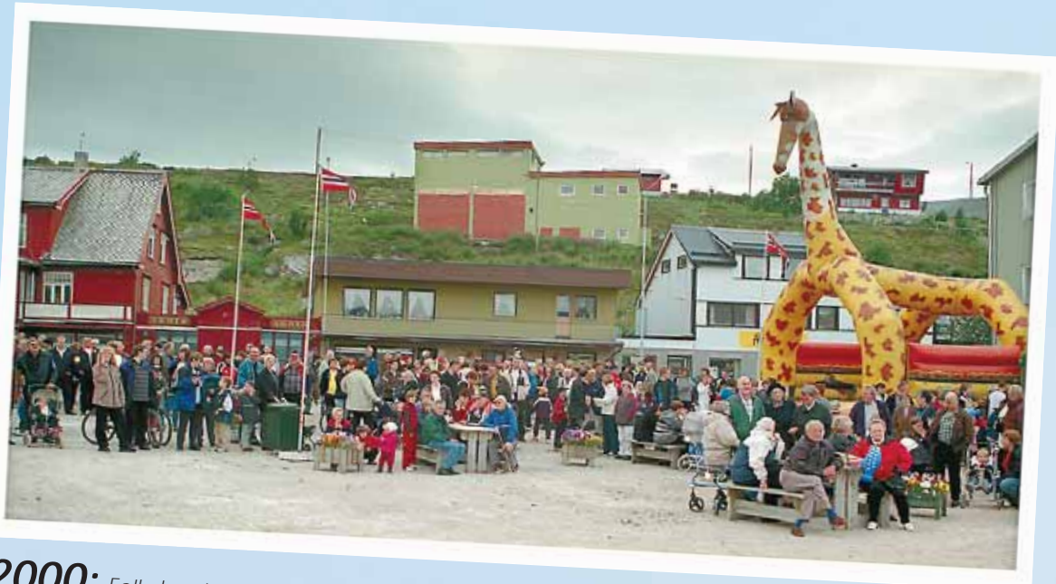
2000: Folkehav i sentrum.