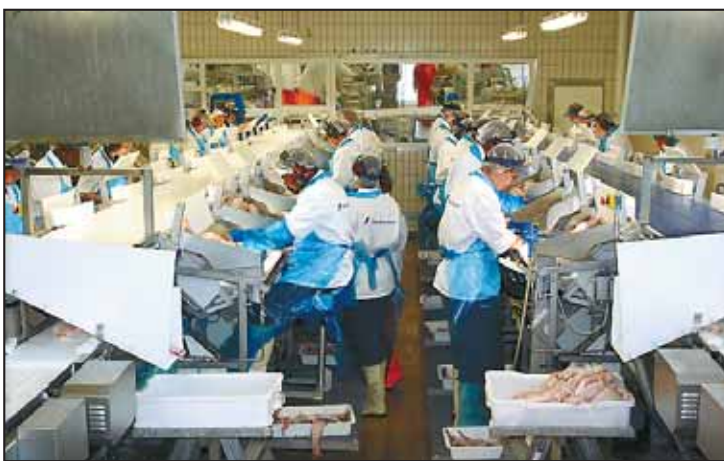
RÅSTOFFMANGEL: Det kan bli råstoffmangel i løpet av høsten. Her fra filetproduksjonen.

– Norway Seafoods skal framstå som et reint produksjons- og salgsselskap. Det er også kjent at Røkke