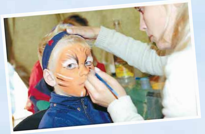
1999: Klargjøring før karneval.

Det er blitt tradisjon at utflyttede båtsfjordinger setter kursen til sine røtters opprinnelse i uke 30. For da blir det invitert til offentlig fest, gjennom det tradisjonellrike arrangementet «Båtsfjord i fest». Da samles gamle kjent, utflyttede og fastboende til fest og morro. Vi har funnet fram noen bilder fra Finnmarkens arkiv fra tidligere «Båtsfjord i fest»-arrangementer. Vi lar bildene tale for seg selv, og presenterer 1990-programmet.