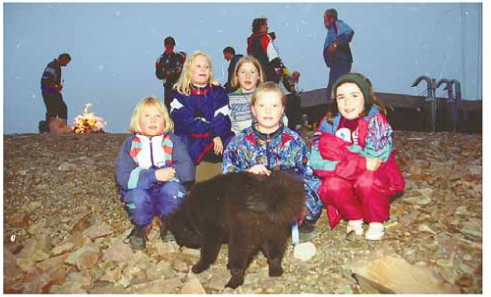
1996: Barn og hund.