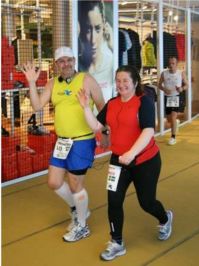
Tenk å være så blid - når en "må" løpe så lenge.