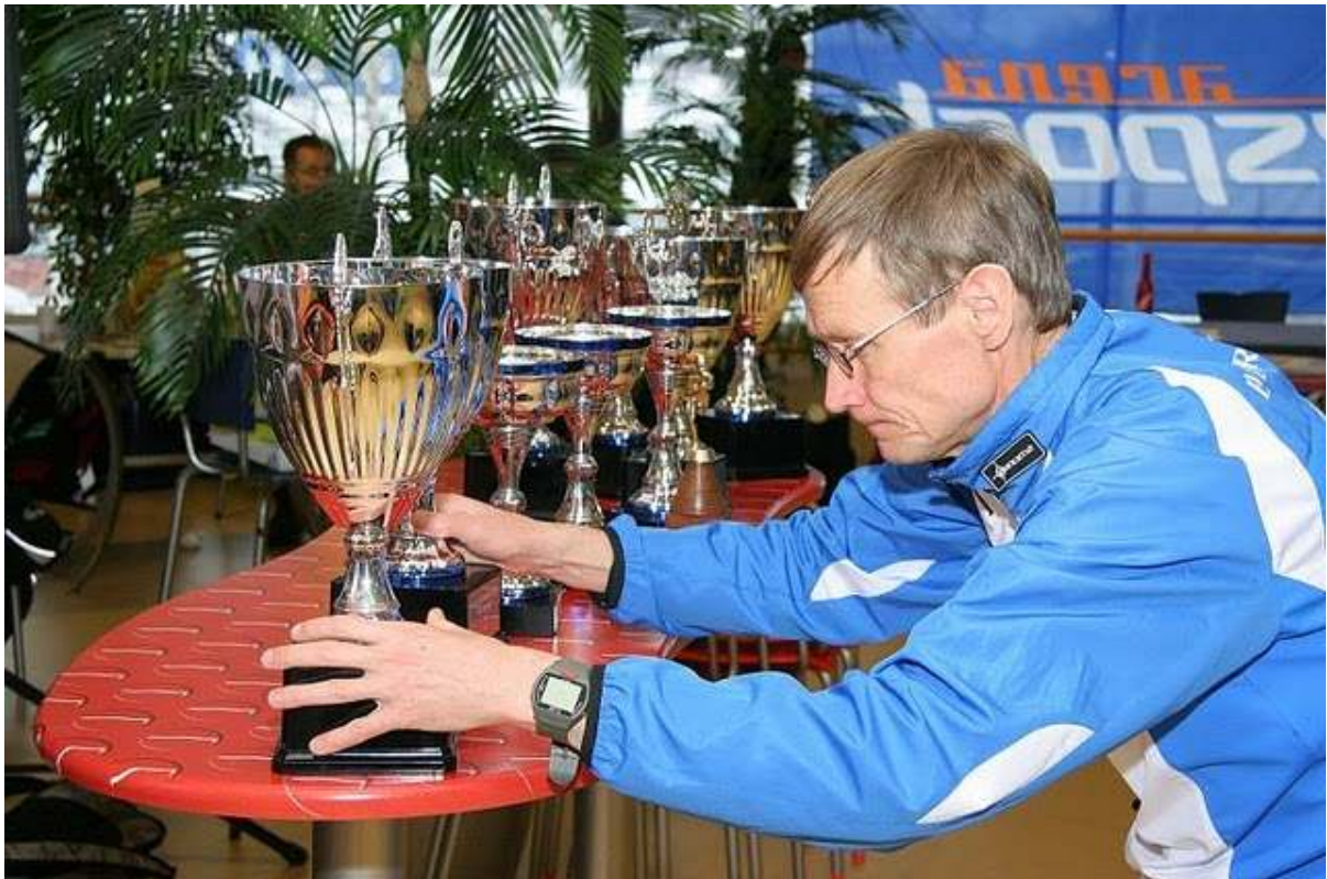
Flotte premier til de beste.