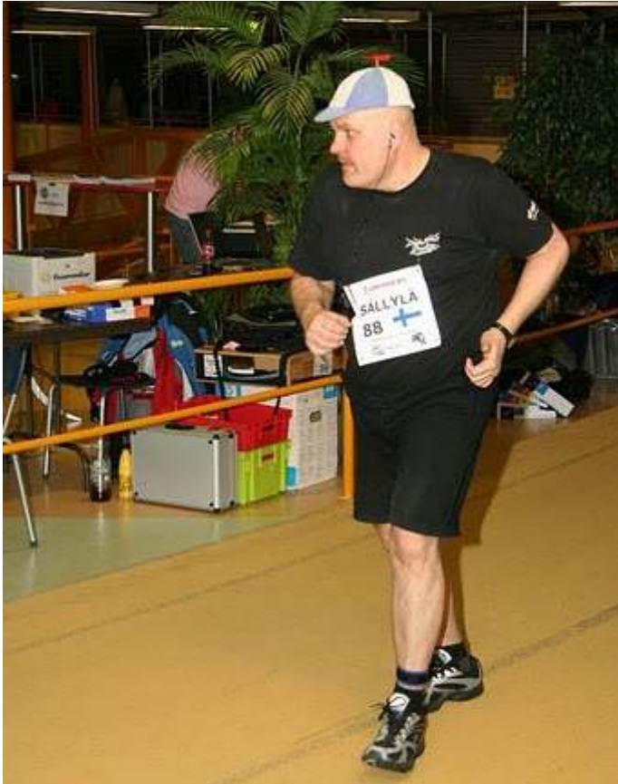
Her er propellen på plass. Det hjalp sikkert godt.