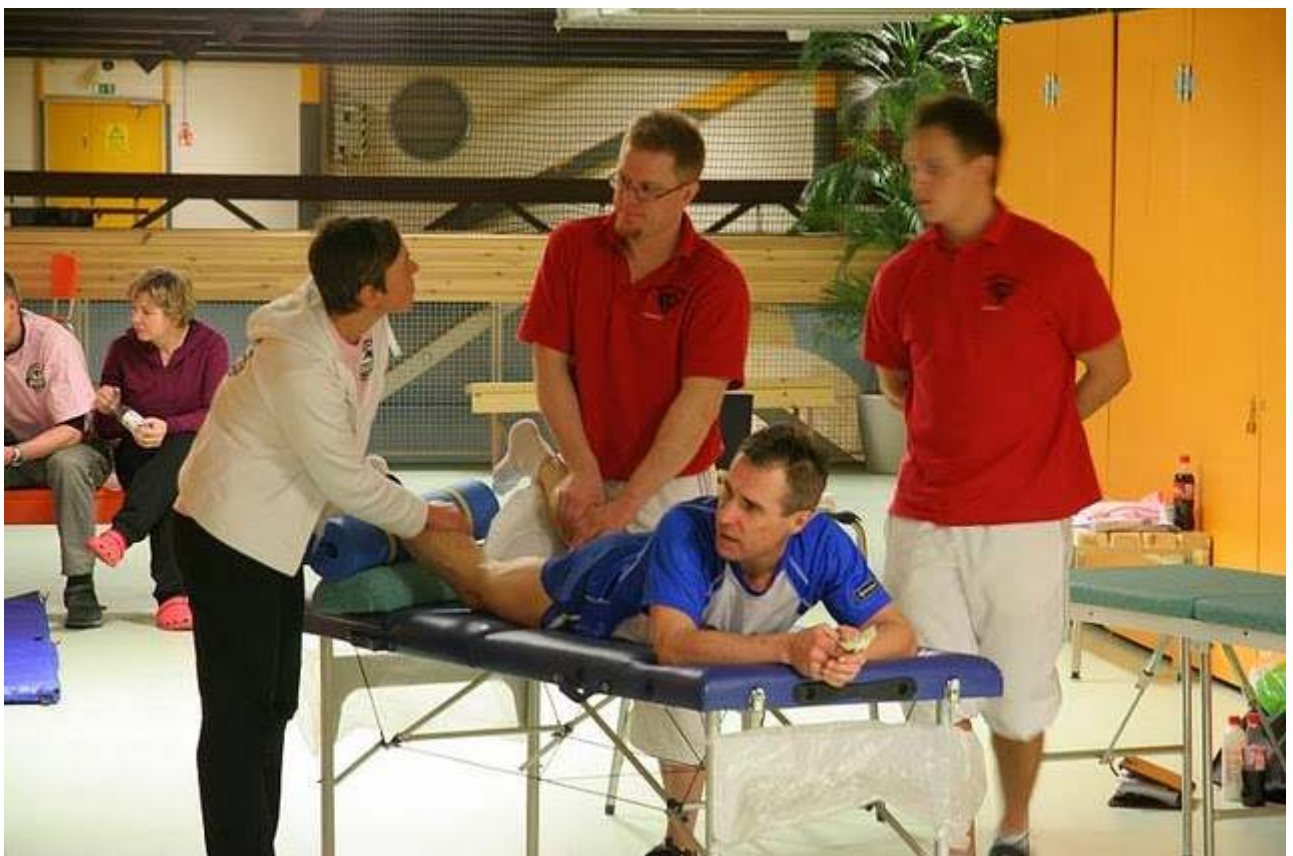
Noen trengte behandling underveis – ikke så rent få etter.