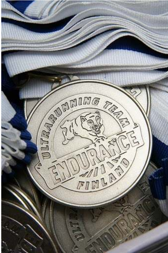
Medaljene var fine - og alle fikk "sølv".