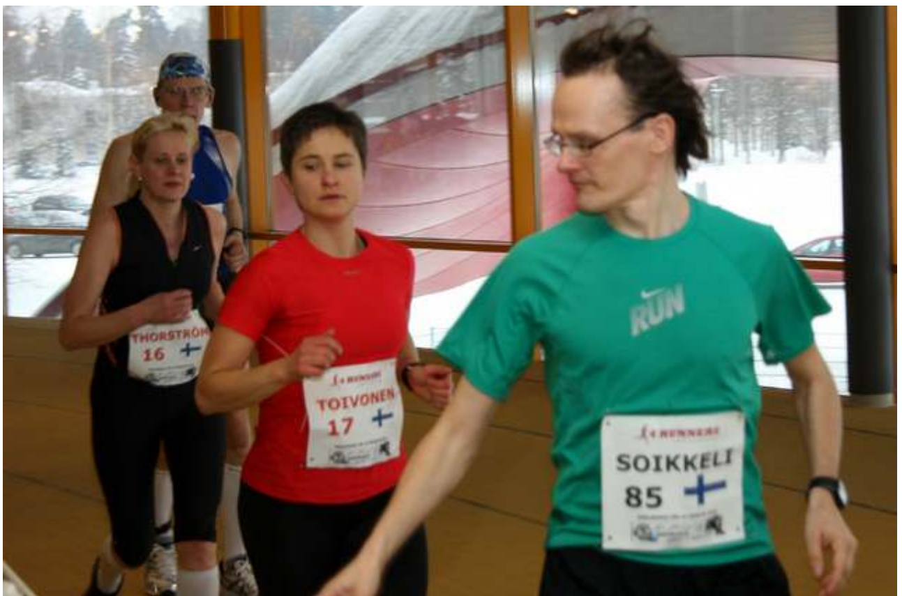
Soikkeli ble beste finne - nr 3 etter to norske. De finske damene bak gjorde også en flott jobb - og ble nr 26 og 39 - totalt.