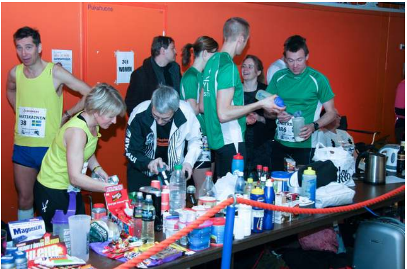
I Sverige gjør de seg også klar. Hvem "vinner" av broderfolket?