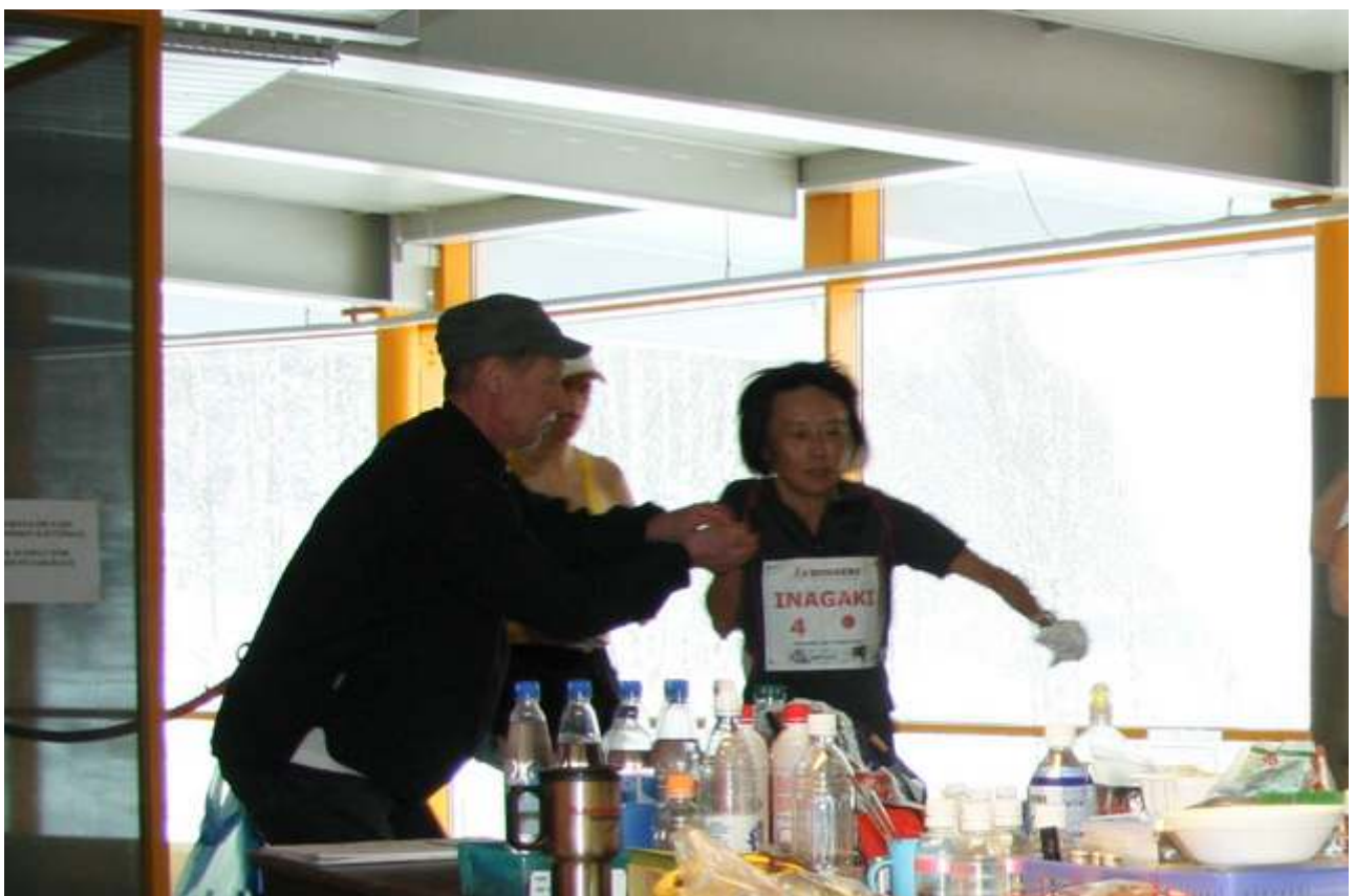
Japan hadde egen matstasjon. Hun sløste ikke med sekundene der. Men slik er det vel når en skal sette verdensrekord?