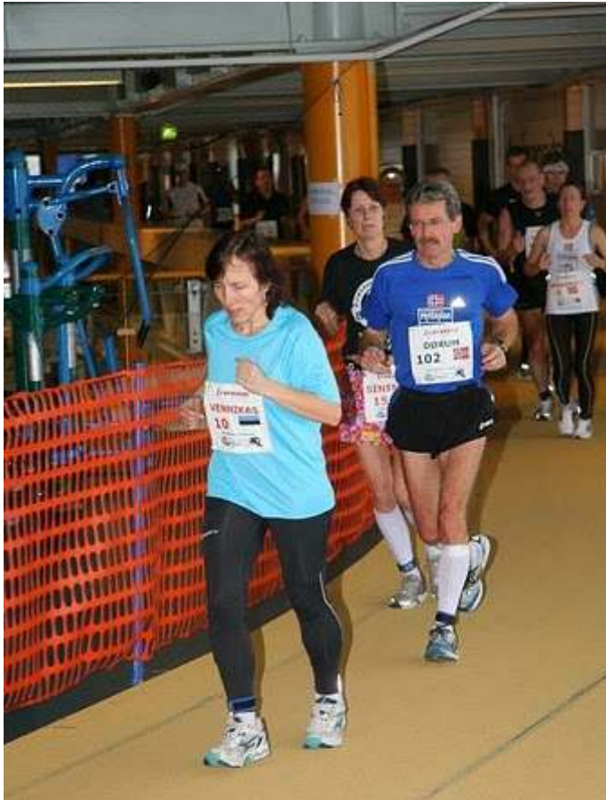
Og Dørum løp seg inn på landlaget. Vennikas fra Estland ble nr 14 i dameklassen