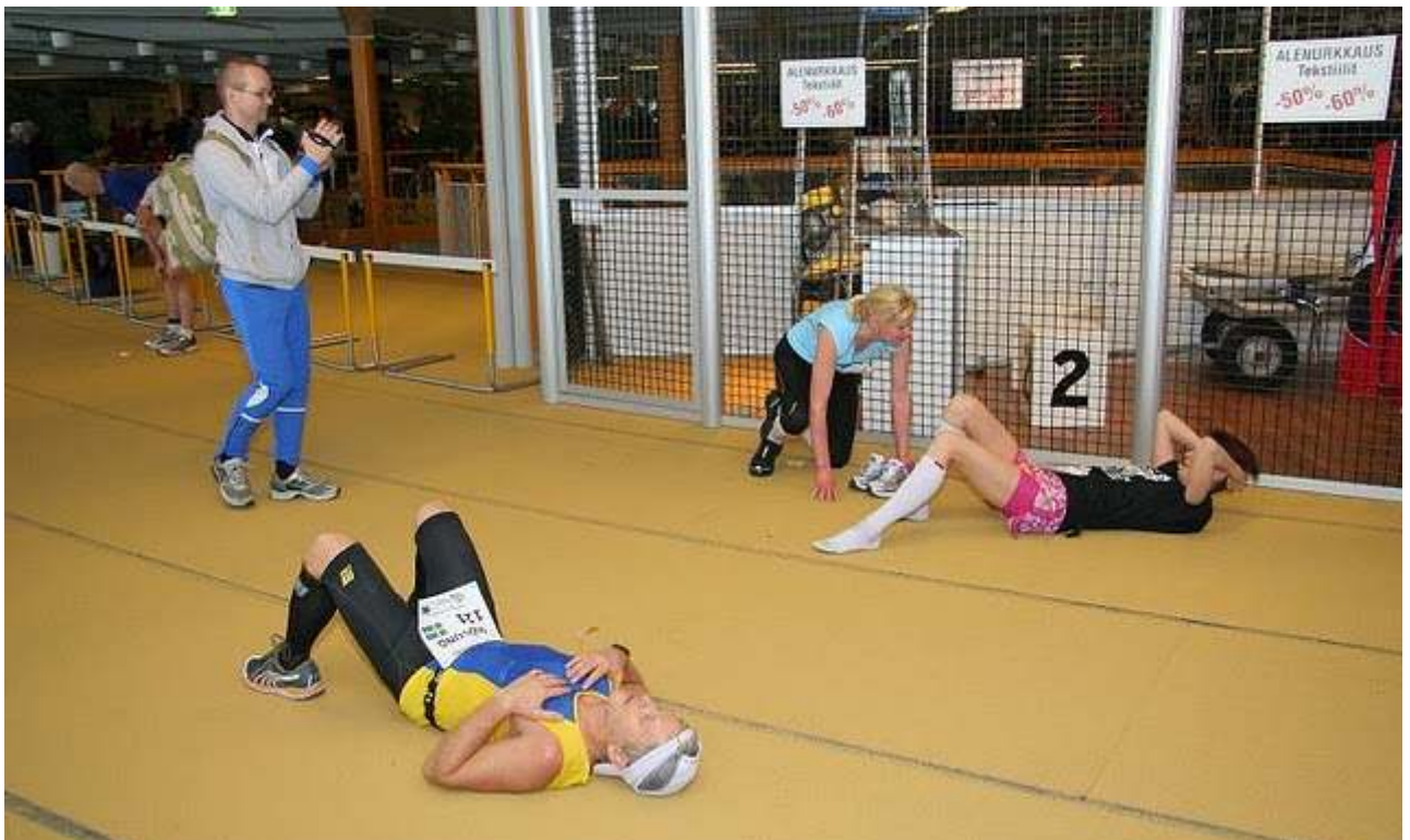
Der var det slutt. Herlig!!!