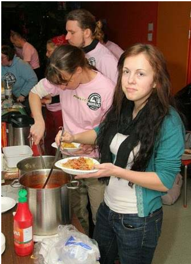
God innsats fra på matstasjonen. De holdt oss gående - og de var utrolig positive – i 24 timer.