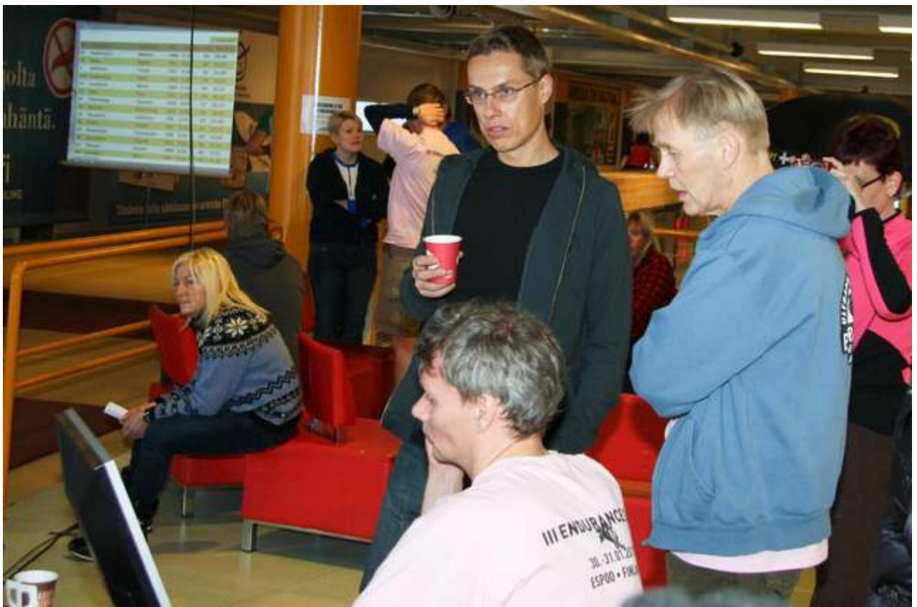
Den finske utenriksministeren fulgte med. Han er selv en god maratonløper. Bare synd at det var vi norske som presterte - og ikke finnene..... Det ser ut som om han er klar over det.