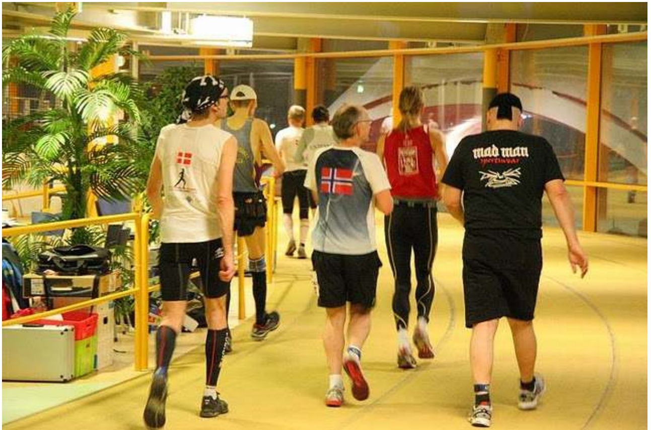
Hei - to norske. En vinner og en som heller ikke gjorde de så verst. "Mad man" sto på - time etter time - hele døgnet igjennom.