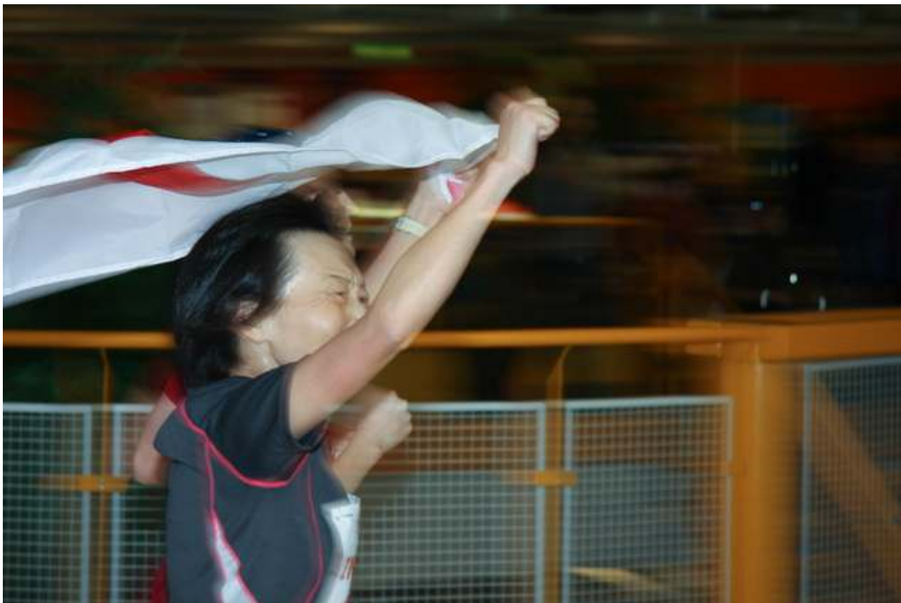
Full fart til siste sekund!