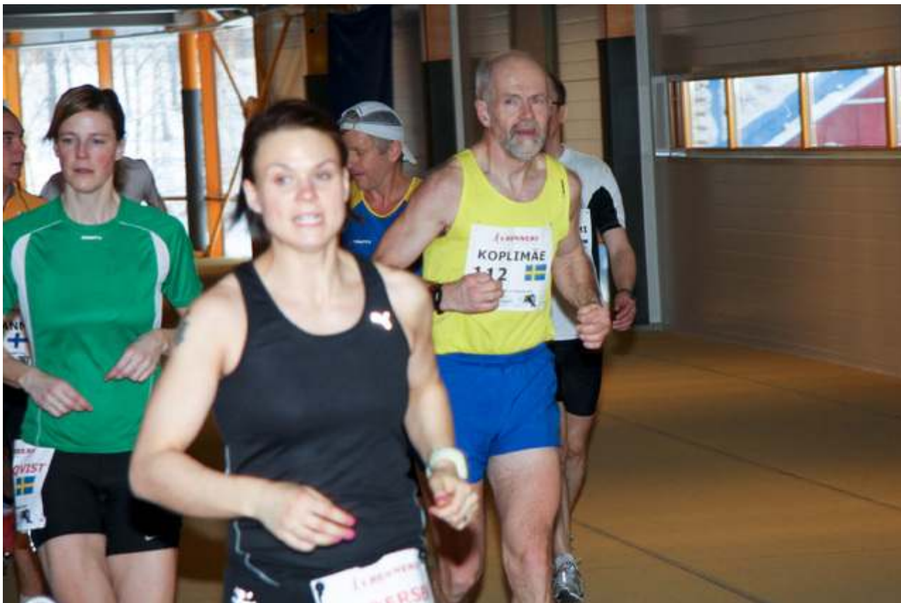
Koplimäe er en gammel seig ultraløper som har vært med på mye. 60 år i år.