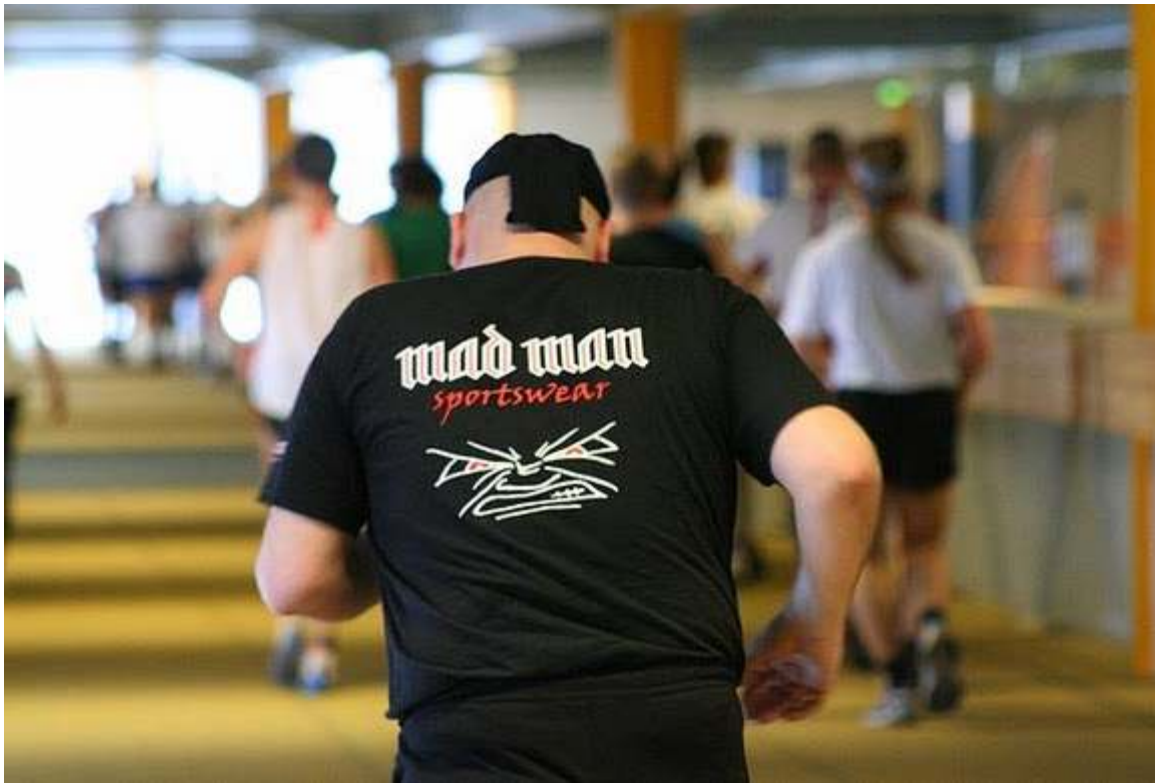
Mad man – fra Finland.