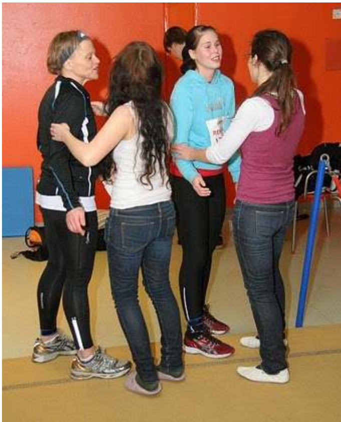
Mor og datter får gratulasjonsklem. Også jeg fikk klem fra disse jentene - som bejublet oss hele døgnet gjennom. Veldig bra.