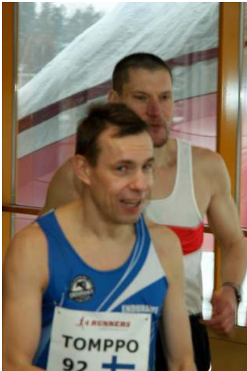
Tomppo - en av de beste finnene. Nr 7 i herreklassen til slutt. Likner han litt på Mister Bean? Han har flotte tider på 100-km og 12-timers, så han kommer nok igjen. Se opp - nordmenn.