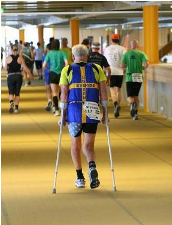
KG vekslet mellom løp og krykker - og søvn.