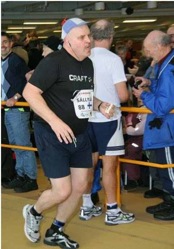
Og propellmannen var sikkert også fornøyd. Han fullførte og hadde ca. 25 personer bak seg