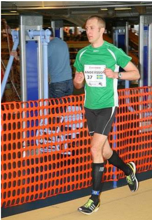
Det var to Andersson med i Espoo. Den svenske var i utgangspunktet best - men den norske ble best.