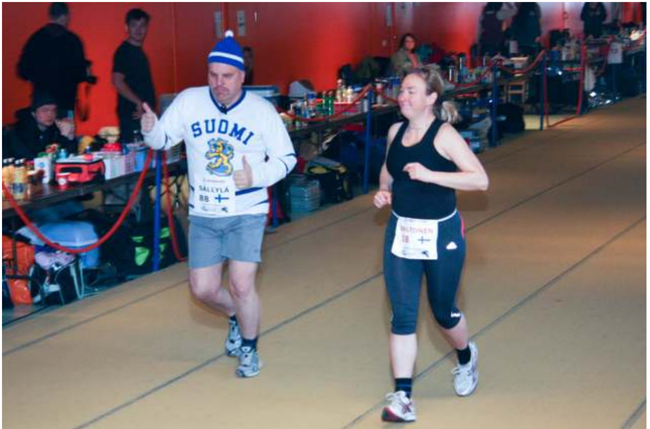
Senere byttet han til lue med propell.