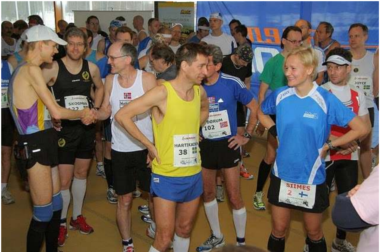
Vi ønsker hverandre "god tur".