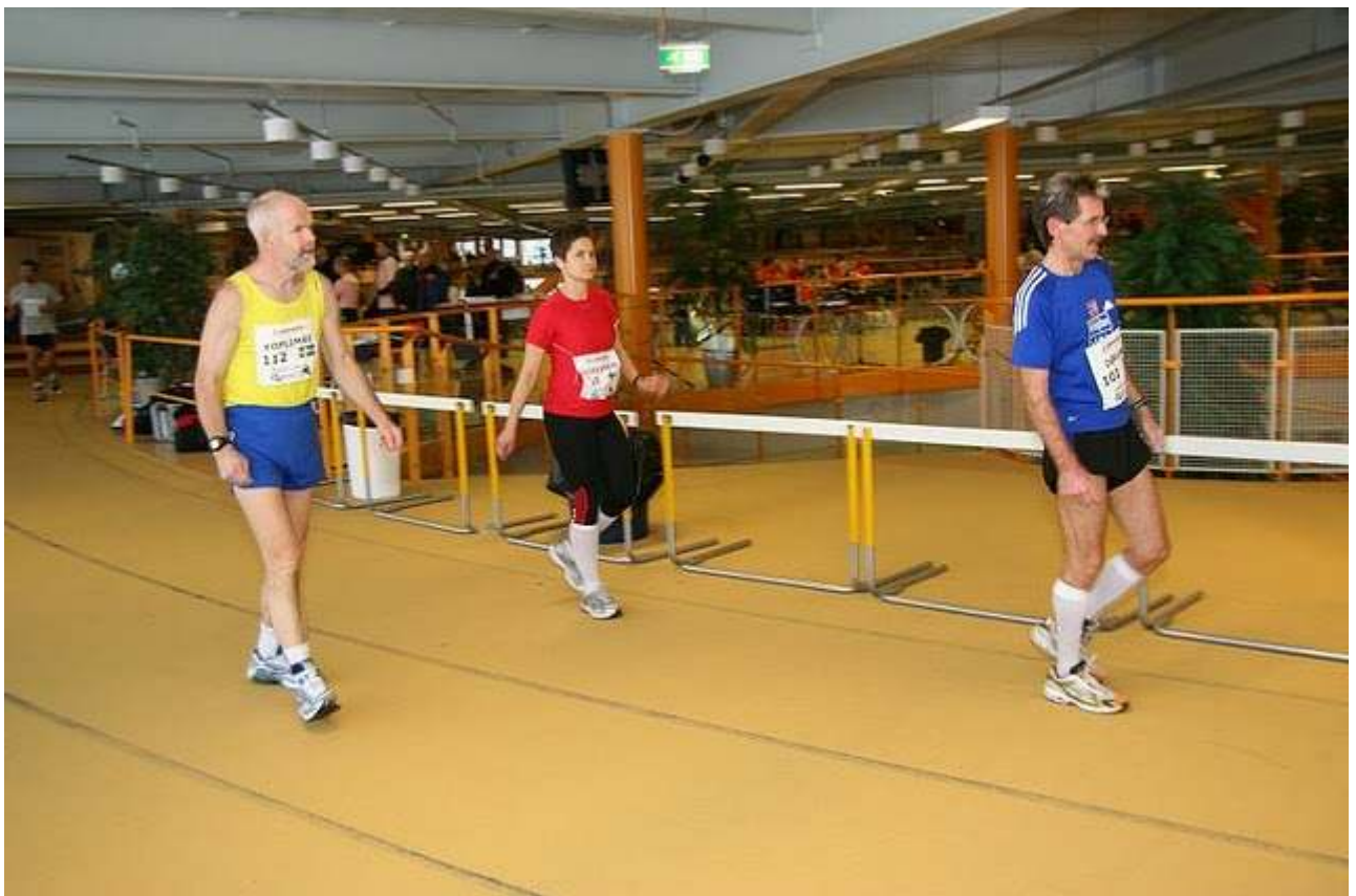
Lars var godt gåen på slutten. Men det skal han ha - han gav aldri opp.