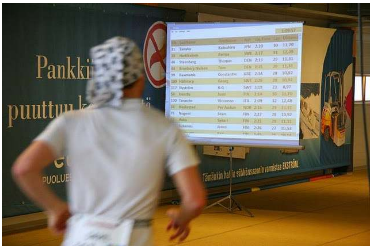
Denne tavla oppdager jeg ikke før etter flere timer. Mitt navn er langt nede - foreløpig