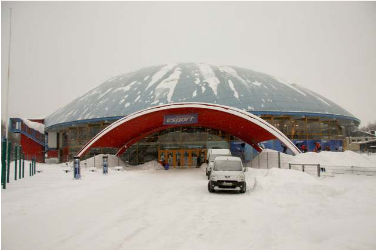
Espoo Arena. Fantastisk hall for alle behov.