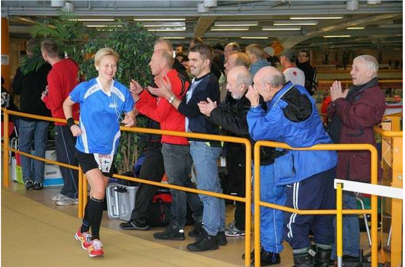
Ouiti vet nå at hun har satt finsk rekord – igjen. Sikkert en herlig følelse.